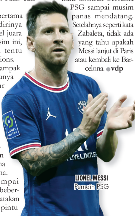
LIONEL MESSI Pemain PSG

Messi kabarnya menghormati kontrak bersama PSG sampai musim panas mendatang. Setelahnya seperti kata Zabaleta, tidak ada yang tahu apakah Messi lanjut di Paris atau kembali ke Barcelona. ●vdp