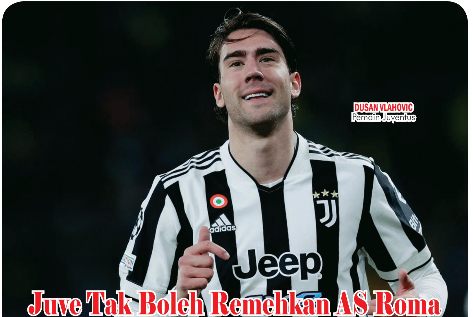
DUSAN VLAHOVIC Pemain Juventus